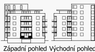
Západní pohled Východní pohled