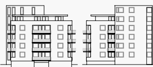
Západní pohled Východní pohled