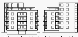
Západní pohled Východní pohled